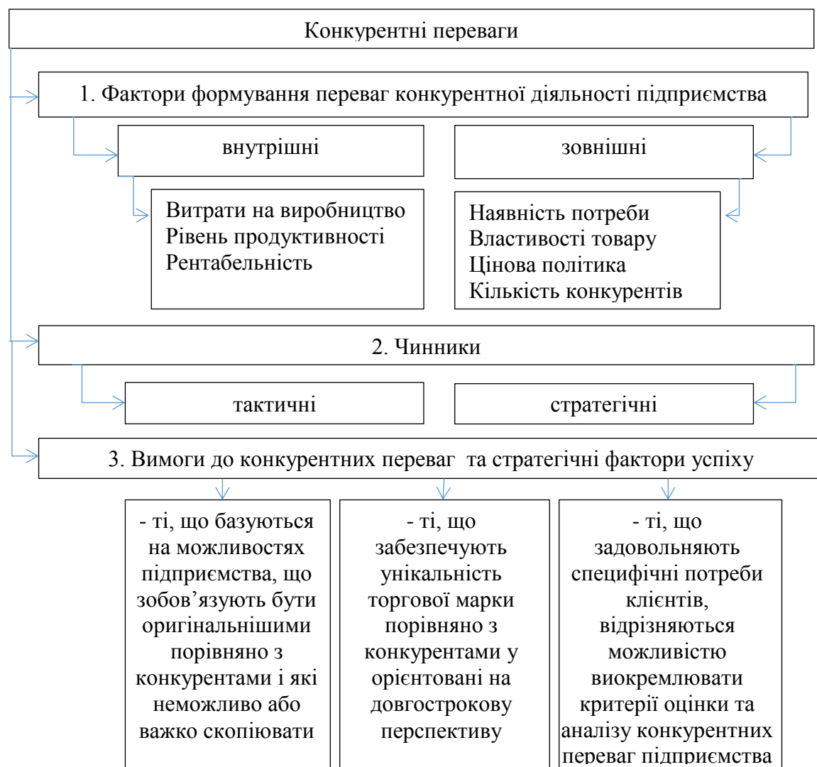
Рис. 2. Характеристики конкурентних переваг ключових факторів діяльності підприємства

Стосовно конкурентних переваг також можна сформулювати стратегічні вимоги (можливі форми реагування) (рис. 2) [2; 4]. Вимоги будуть залежати від визначення середовища.