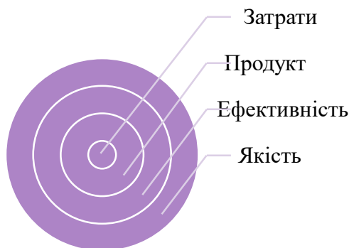
Рис. 2 Результативні показники ПЦМ

Похвально, що в процесі дії програмно-цільового методу використовується модель «Ресурс – Результат», що передбачає залежність наданих розпоряднику коштів на основі отриманого результату (рис.3).