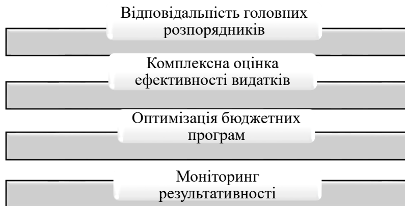
Рис. 1. Переваги програмно-цільового методу

Тож ймовірно є визначення, що програмно-цільовий метод – це програмування бюджету, що націлене на результат (рис.1) [1].