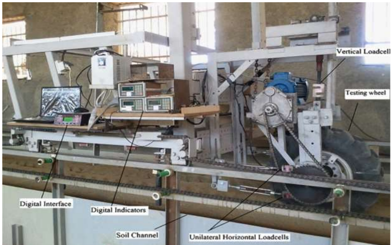
Рисунок 2 - Ґрунтовий канал для вимірювання параметрів роботи сільськогосподарських коліс [7]

Привід здійснювався двигуном постійного струму, що надавало можливість безступінчасто змінювати швидкість руху та обертання у широкому діапазоні. Установка мала додаткову систему керування моментом запуску та зупинки ротора. Узгоджувальний механізм, що координував поступальний рух візка та обертання ротору, містив зубчасту рейку. За допомогою установки отримано значний обсяг експериментальних матеріалів, використаних при створенні системи фрезерних та тягово-привідних машин [6].