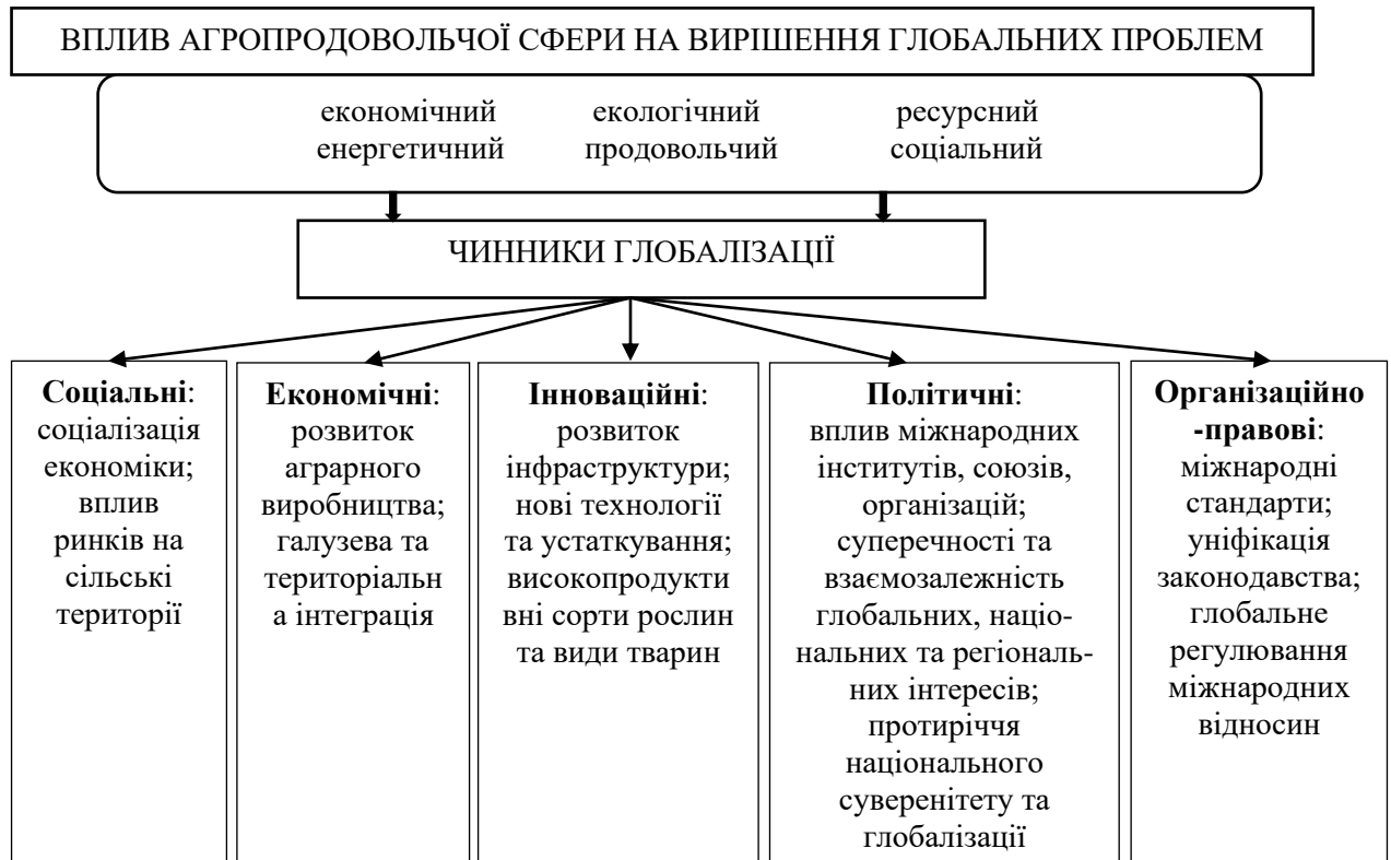
Рис. 2. Проблеми та чинники глобалізації, що впливають на агропродовольчу сферу [адаптовано авторами на основі 8, 9]

урахуванням наведеного вище можемо визначити засади глобалізації та чинники, які визначальний вплив на агропродовольчу сферу (рис. 2).