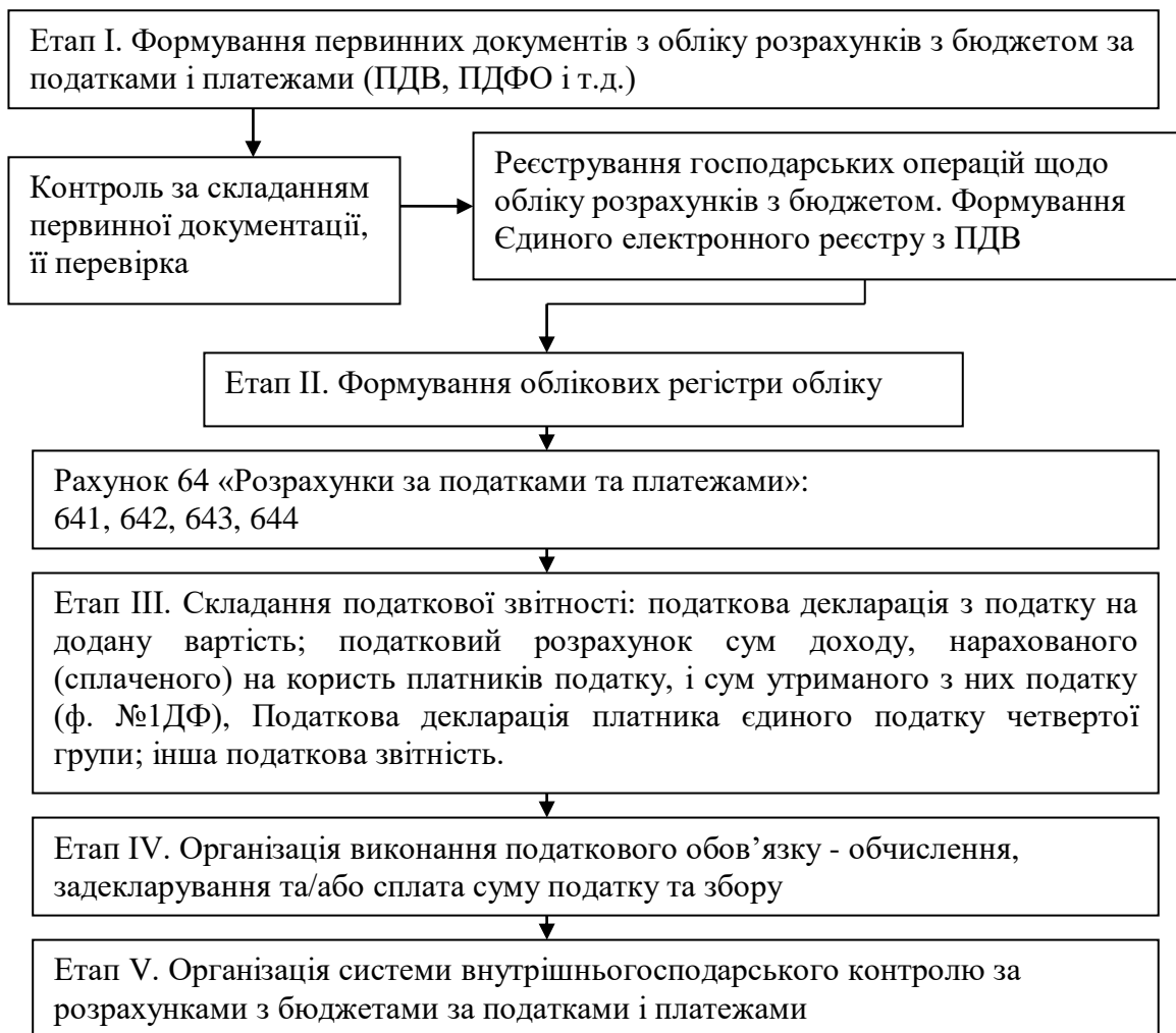
Рис. 4. Послідовність організації облікового процесу щодо розрахунків з бюджетом за податками та платежами

У третьому розділі «Облік оподаткування доходів фізичних осіб» висвітлено порядок обліку розрахунків за податком на доходи фізичних осіб.