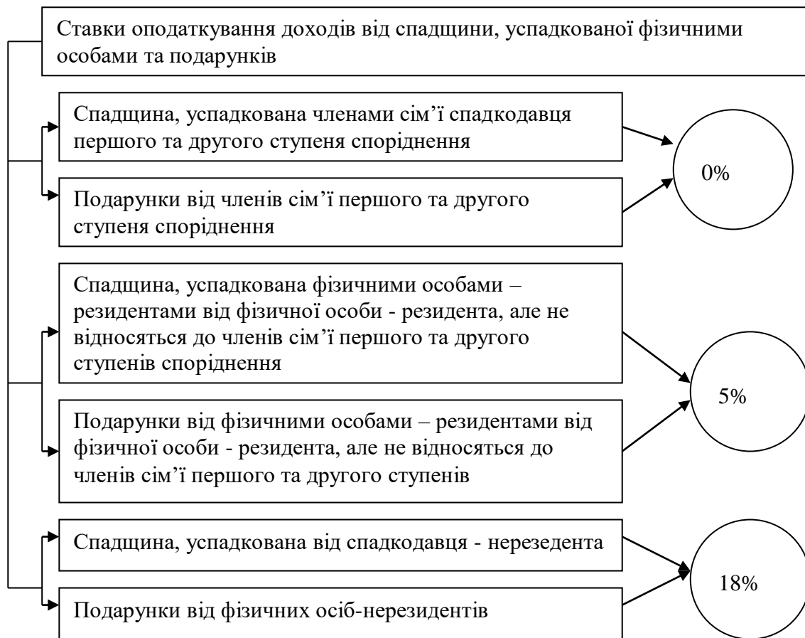
Рис. 3. Ставки оподаткування доходів від спадщини, успадкованої фізичними особами

У другому розділі « Фінансово-економічна характеристика діяльності підприємства » проведено аналіз фінансово-економічної діяльності ТОВ «Савинці» та вивчено основні аспекти облікової політики. Розраховані показники оцінки платоспроможності ТОВ «Савинці» показали, що у 2017 році коефіцієнти є вище нормативного значення, що говорить про ліквідність та платоспроможність досліджуваного підприємства.