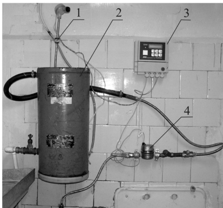
Рис. 1. Оборудование для водоподогрева и учета потребления воды: 1 – термопреобразователь сопротивления; 2 – электронагреватель воды; 3 – тепловычислитель СПТ 941; 4 – водосчетчик