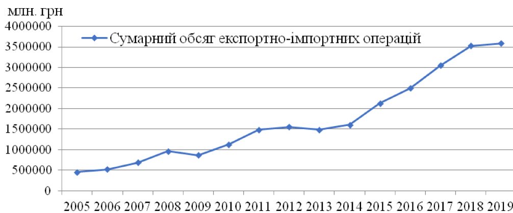
Рис.1. Динаміка обсягу зовнішньої торгівлі України за 2005-2019 рр.

Аналіз даних Державної служби статистики України [90] свідчить про істотне зростання обсягів зовнішньої торгівлі України впродовж останніх років (рис. 1).