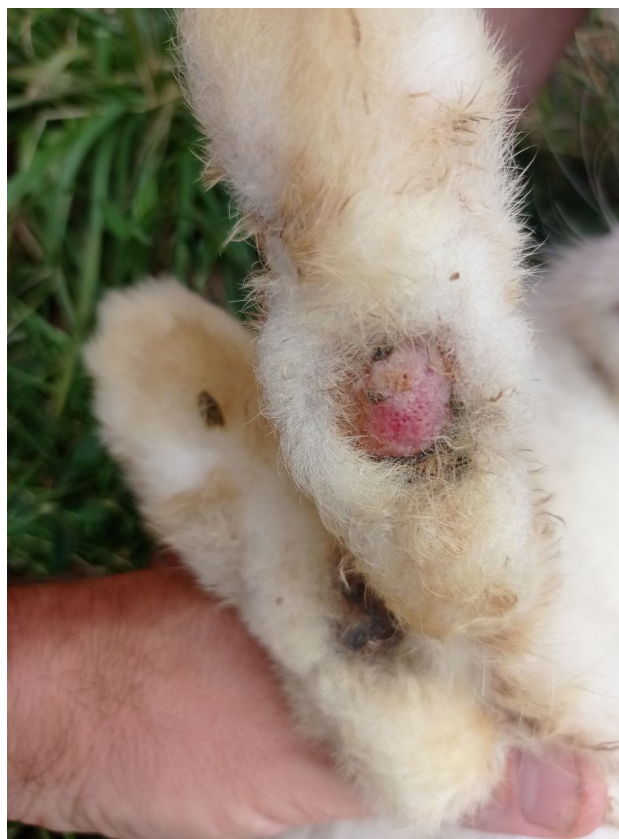
Рис. 1, 2. Алопеція, гіперкератоз, ліхеніфікація, початок утворення виразок середини плесни та п'ятки, оцінені у 4 бали

Влітку відсоток хворих на пододерматити кролів в усіх господарствах підвищився і перебував у межах 24,4–43,6 %. Більшість пошкоджень шкіри підшви задніх лап оцінювалися у 4–6 балів. Дані показники розміщувалися в діапазоні 79–93 %. Восени кількість хворих тварин зменшувалася і становила 15,4–19,0 %. Більшість хворих тварин при цьому характеризувалися ураженнями 4–6 балів. У господарствах відсоток таких тварин коливався у межах 83–100 %.