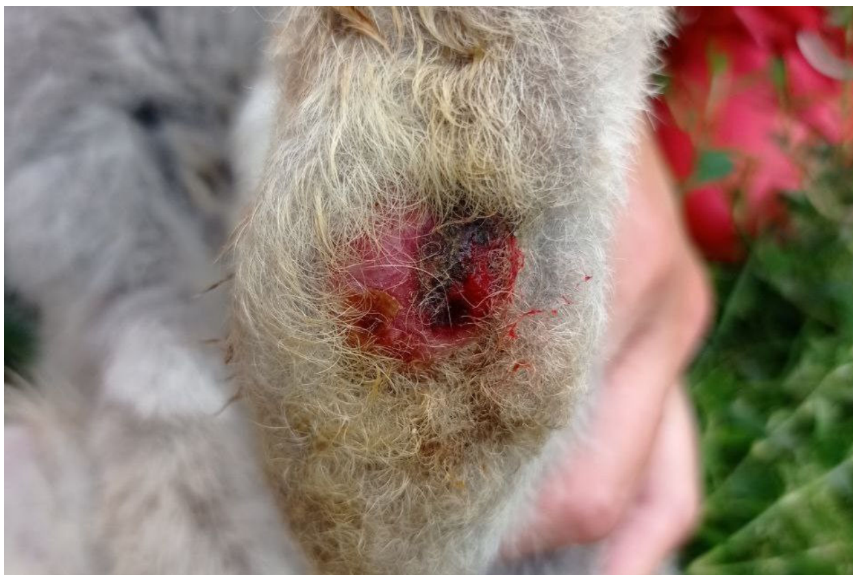
Рис. 5. Гіперкератоз та глибока виразка п'ятки, оцінені у 6 балів