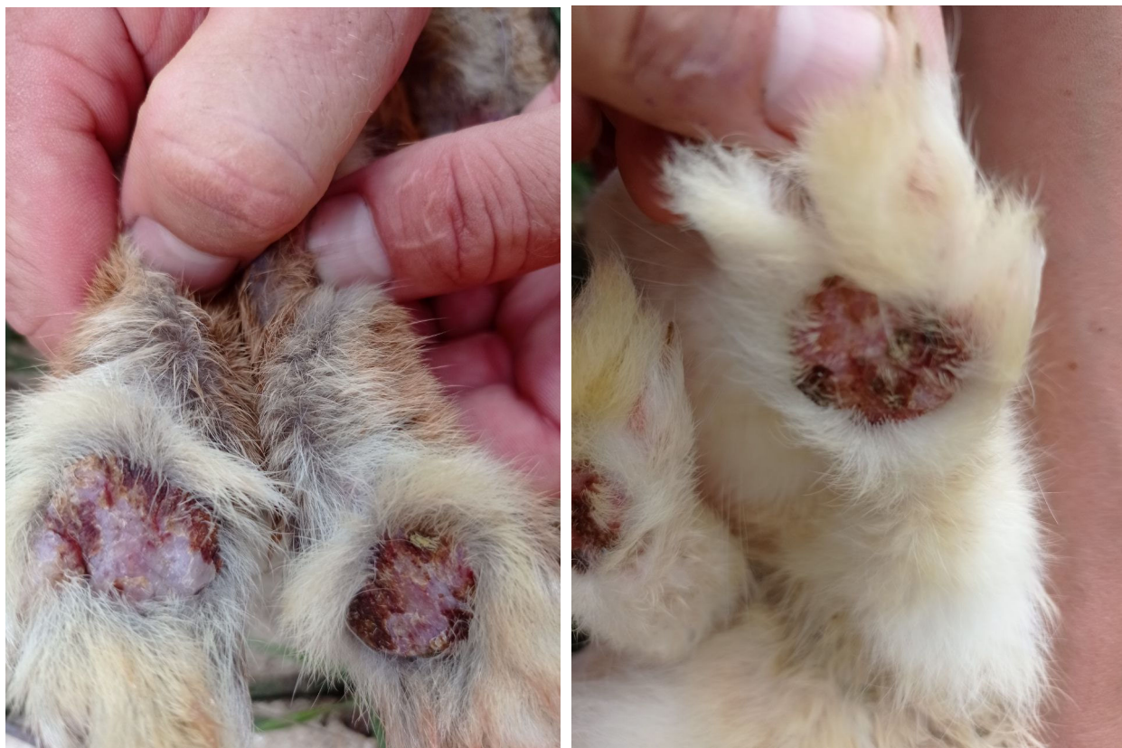
Рис. 6, 7. Гіперкератоз, ліхеніфікація, поверхневі виразки підошовних подушечок, оцінені у 5–6 балів

Отже, при дослідженні кожного окремого господарства можемо встановити схожі закономірності. Аналіз отриманих даних свідчить, що найвищий відсоток хворих на пододерматити кролів з явними клінічними ознаками та важкими формами був зареєстрований влітку.