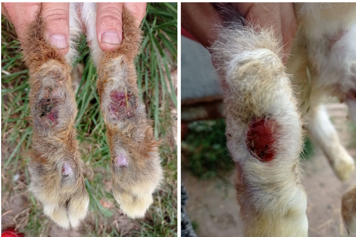
Рис. 3, 4. Гіперкератоз та поверхневі виразки з кров'янистими виділеннями середини плесни та п'ятки, оцінені у 5 балів