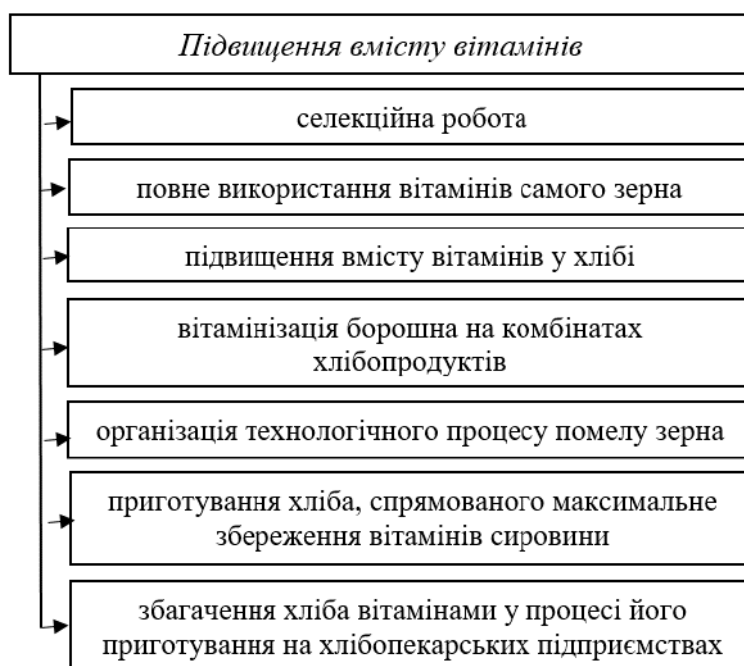
Рис. 1. Напрями підвищення вмісту вітамінів у складі хліба

За даними [3] хліб містить такі вітаміни, мг: А – 0,003; В1 – 0,02; В2 – 0,09; В3 – 2; В5 – 0,55; В6 – 0,2; В9 – 0,03; Е – 2,3; Н – 0,002 тощо. Проте їх кількісний вміст не повністю задовольняє потреби споживачів у мікронутрієнтах.