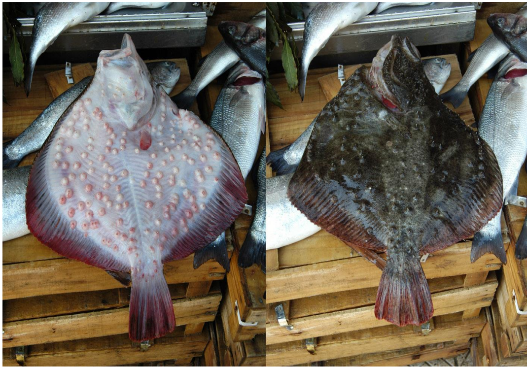
Рис. 1. Камбала-калкан ( Scophthalmus maeoticus )

На стадії личинки камбала-калкан має дуже низьку виживаність, оскільки ікрою та личинками живляться всі організми, раціон яких складається з планктонних організмів. На ранніх стадіях життя камбалоподібні проходять фазу, яка називається «метаморфоз» (рис. 2).