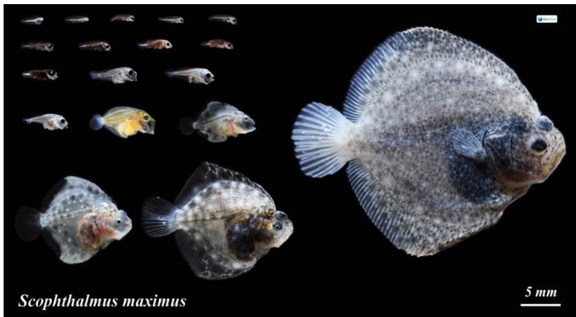
Рис. 2. Метаморфоз камбали-калкана ( Scophthalmus maeoticus )

солонуватих і прісноводних водоймах. Ці види широко зустрічаються в помірних водах від 5 °С до 25 °С. Камбала-калкан під час нерестового періоду відкладає невеликі ікринки, що мають прозоре забарвлення. Ікра пелагічна. Діаметр ікринок коливається від 1,22–1,33 мм. Ікра камбалових має малі розміри та містить одну жирову краплину, яку добре видно бо сама ікринка повністю прозора. Діаметр жирової краплини 0,15–0,17 мм.