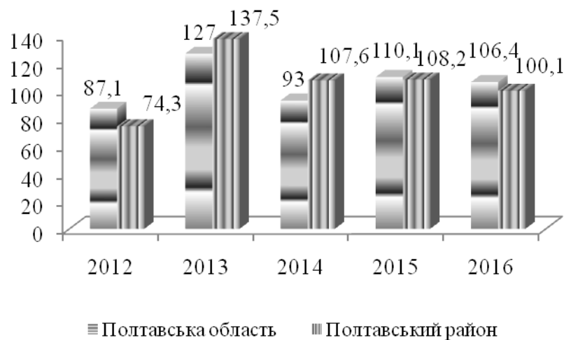
Рис. 1. Динаміка індексів продукції сільського господарства у сільськогосподарських підприємствах, відсотків до попереднього року [2; 5, с. 104]

Динаміка індексів продукції сільського господарства у сільськогосподарських підприємствах Полтавської області за 2012-2016 рр. свідчить про те що відбувались значні коливання у обсягах виробництва як по області, так і по району (рис. 1).