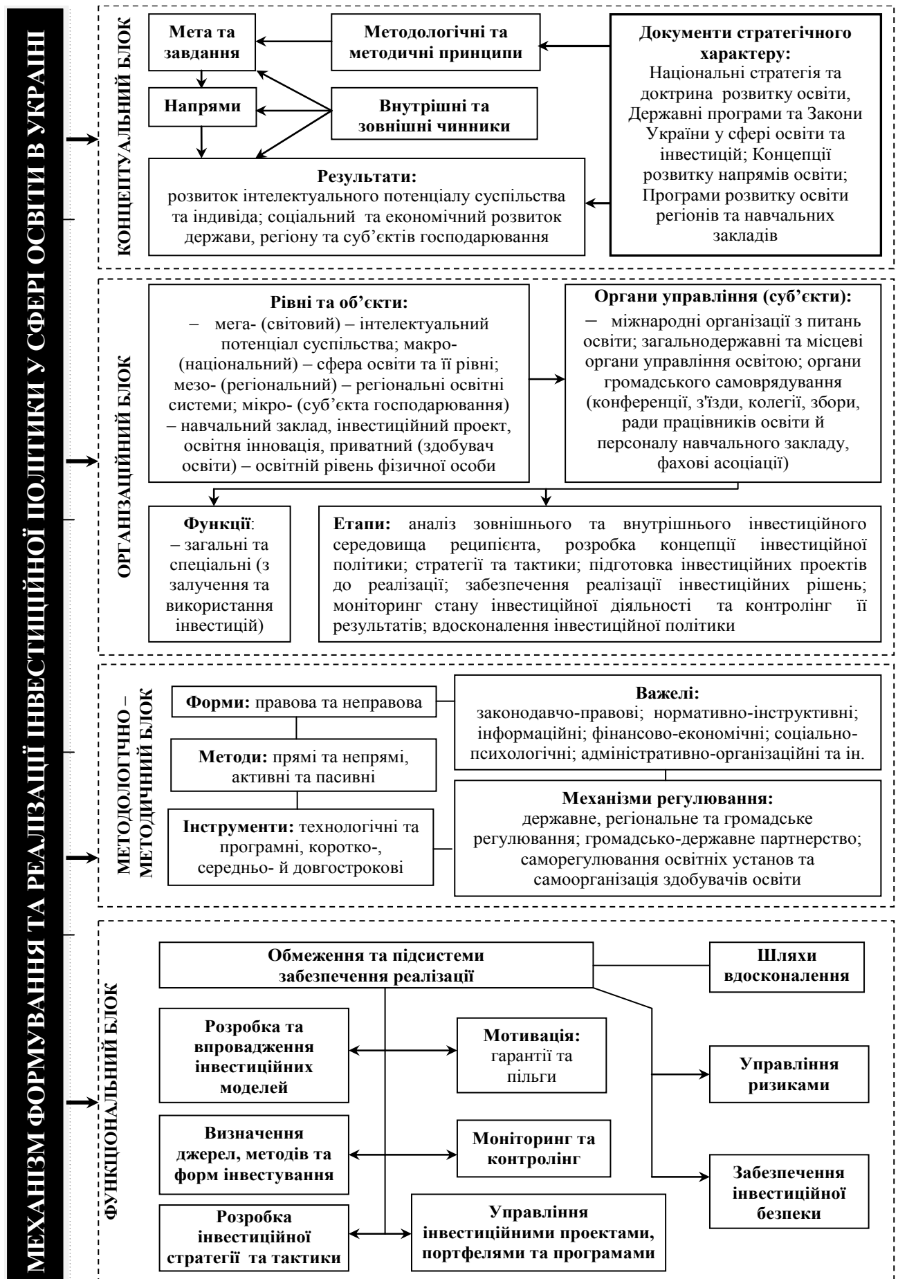
Рис. 3. Механізм інвестиційної політики у сфері освіти