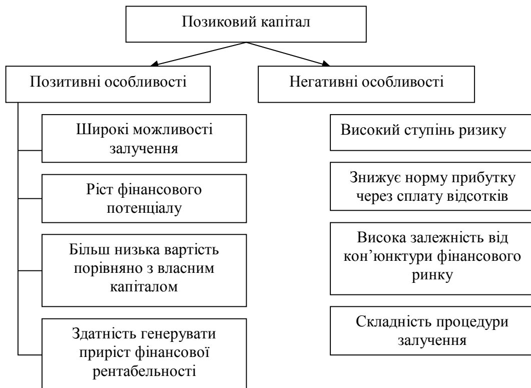
Рис. 3. Характеристика позикового капіталу

З метою оптимізації структури капіталу для досліджуваного підприємства доцільним є використання підходу максимізація рівня рентабельності власного капіталу.