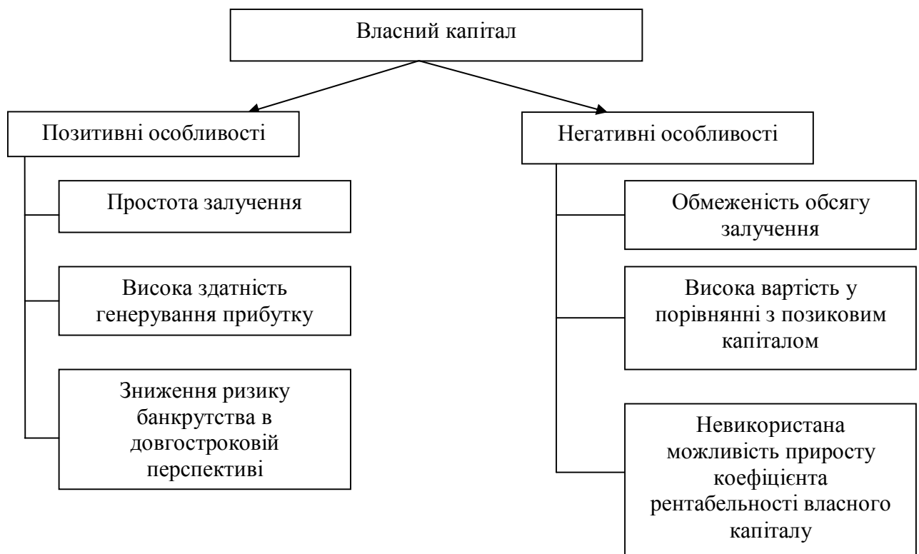
Рис. 2. Особливості власного капіталу

Результат господарської діяльності підприємств в значній мірі залежить від того, на скільки підприємство забезпечене фінансовими ресурсами і на скільки ефективно воно використовує наявні фінансові ресурси. Фінансові ресурси підприємства включають в себе власний і позиковий капітал. При умові, що підприємство буде дотримуватись оптимальних пропорцій між власним та позиковим капіталом, буде забезпечено достатній рівень фінансової незалежності, високий рівень рентабельності та збільшено ринкову вартість підприємства. Взагалі визначення оптимальної структури капіталу є одним із основних завдань фінансового управління підприємством. Якщо розглядати зміст поняття «оптимальна структура капіталу», то можна визначити, що це таке співвідношення між власними і запозиченими ресурсами при якому зберігається ефективна пропорційність між коефіцієнтом фінансової стійкості та фінансової рентабельності. І, як наслідок, зростає ринкова вартість підприємства. Тобто, це створення умов, при яких забезпечується максимальне отримання прибутку і максимальна рентабельність. При визначенні оптимальної структури капіталу необхідно враховувати, що кожна із складових капіталу має свої особливості. Позитивні і негативні особливості власного капіталу відображено на рис. 2.