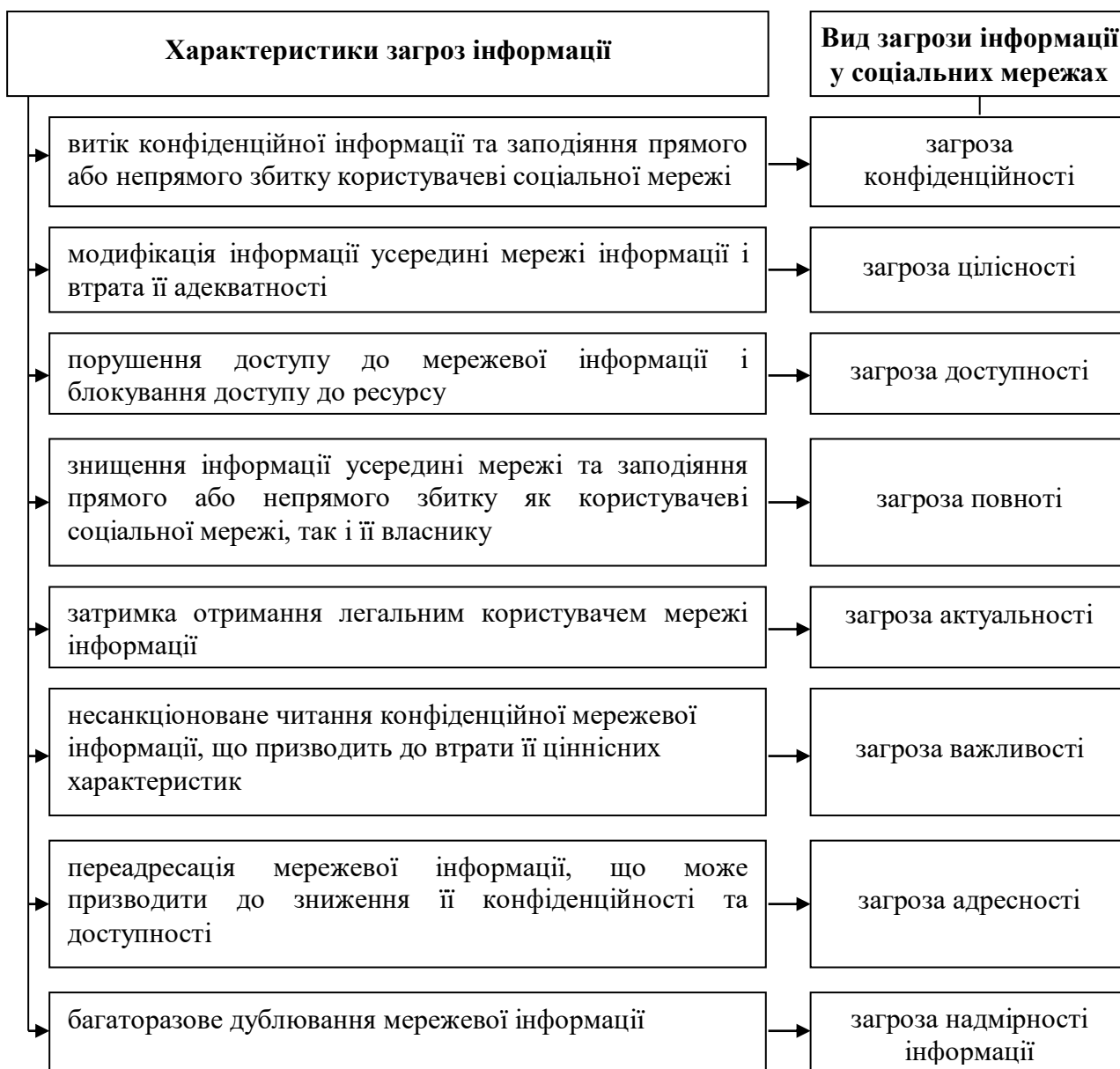
Рис. 2. Типи загроз інформації в соціальних мережах

Узагальнена інформація щодо типів загроз інформації в соціальній мережі, визначена Д. Б. Мехедом, схематично представлена на рис. 2.