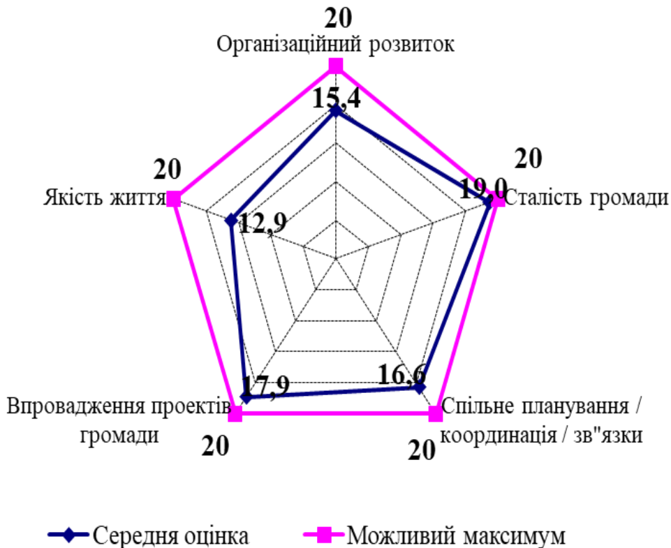
Рис. 2. Оцінка показників розвитку громади сільської місцевості с. Михайлики Шишацької ОТГ

Оцінка місцевого розвитку, орієнтованого на громаду, сільських жителів, формується на основі соціологічного дослідження та створення графічної моделі (рис.2), яка включає показники впровадження проектів громад: організаційний розвиток громади (15,4 бали), якість життя членів громади (12,9 балів), упровадження проектів громадою (17,9 балів), сталість громади (19,0 балів) та спільне планування (16,6 балів).