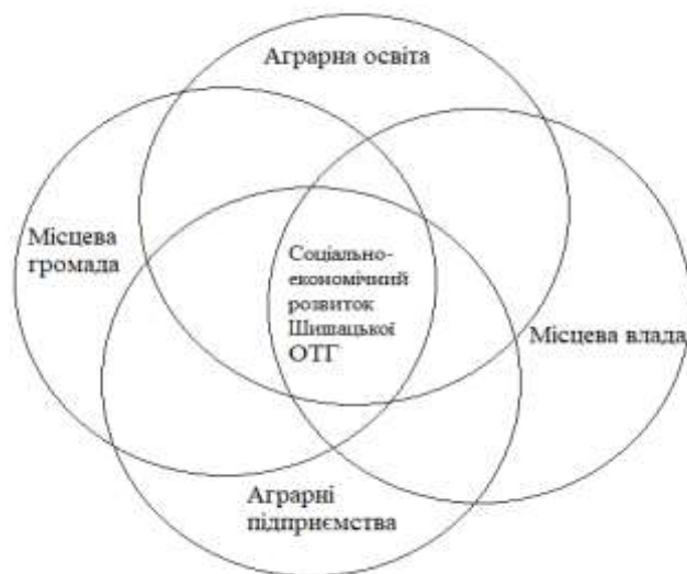
Рис. 3. Схема забезпечення соціально-економічного розвитку Шишацької ОТГ

Розроблено та обґрунтовано напрями розвитку тісної партнерської взаємодії «місцева громада – аграрна освіта – аграрні підприємства – місцева влада», наведені на рис.3.