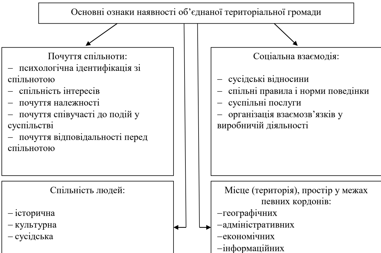
Рис. 1. Основні ознаки, що характеризують наявність об'єднаної територіальної громади

Проаналізувавши погляди різних учених, автор запропонував основні ознаки, що визначають наявність об'єднаної територіальної громади (Рис.1).