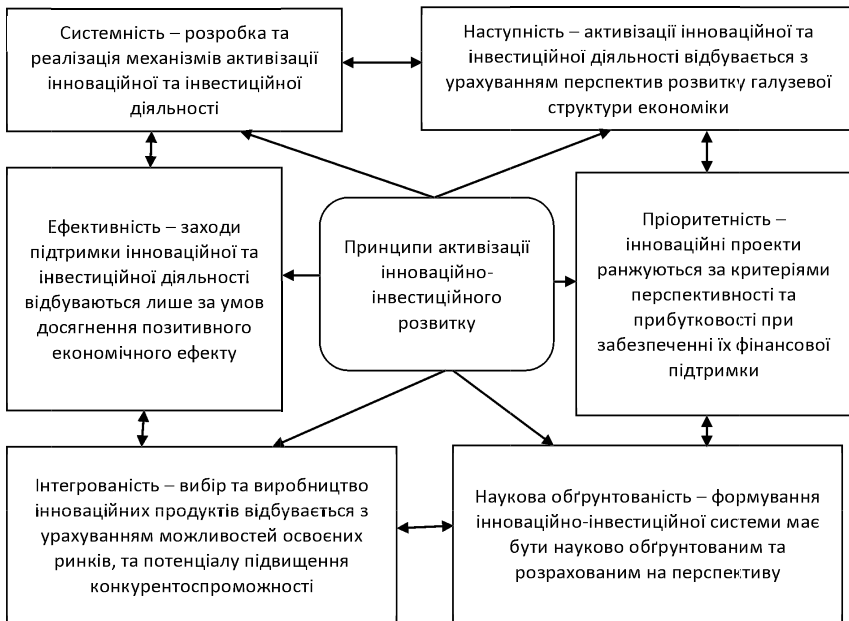
Рис. 1. Принципи активізації інноваційно-інвестиційної політики в межах моделі соціально-економічного розвитку, систематизовано та доповнено авторами на основі [2; 9]

Для практичної реалізації зазначеної моделі розвитку потрібно забезпечити чіткість та зрозумілість принципів її активізації (рис. 1).