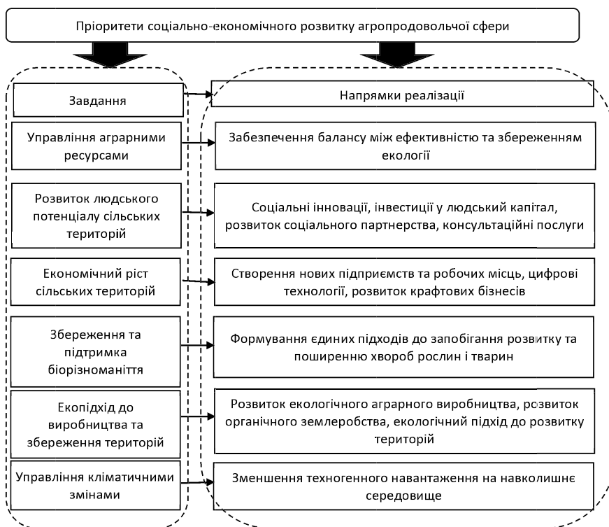
Рис. 3. Пріоритети соціально-економічного розвитку агропродовольчої сфери України, систематизовано та доповнено авторами на основі [2; 8]

Ключовими напрямками реалізації інноваційно-інвестиційних програм розвитку агропродовольчої сфери можна визначити наступні: