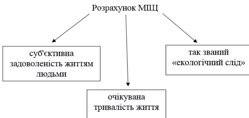
Рис. 1. Розрахунок міжнародного індексу щастя

Міжнародний індекс щастя ґрунтується на загальних утилітарних принципах, що більшість людей хочуть прожити довге і повноцінне життя, а країни прагнуть зробити все можливе для досягнення максимального добробуту своїх громадян, розумно використовуючи наявні ресурси, не завдаючи шкоди довкіллю. Для розрахунку індексу використовуються три показники (рис.1).