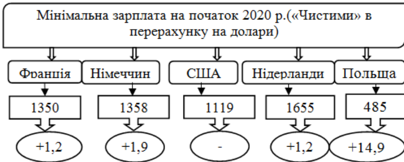
Рисунок 1 – Мінімальна зарплата різних країн, в порівнянні з минулим роком

Купівельна спроможність прожиткового мінімуму розглядається, як необхідна кількість продуктів харчування для проживання на певний період – прожитковий кошик.