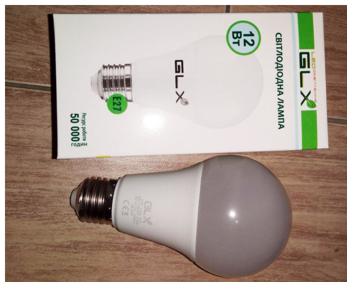
Рис. 2. Світлодіодна лампа GALAXY

У якості джерела світла використовувалася низьковольтна світлодіодна лампа GALAXY (рис. 2, табл. 3) [3]. Лампи накаливання неефективні у даному випадку через високий рівень споживаної потужності, що йде на їх значне нагрівання, тому не розглядалися.