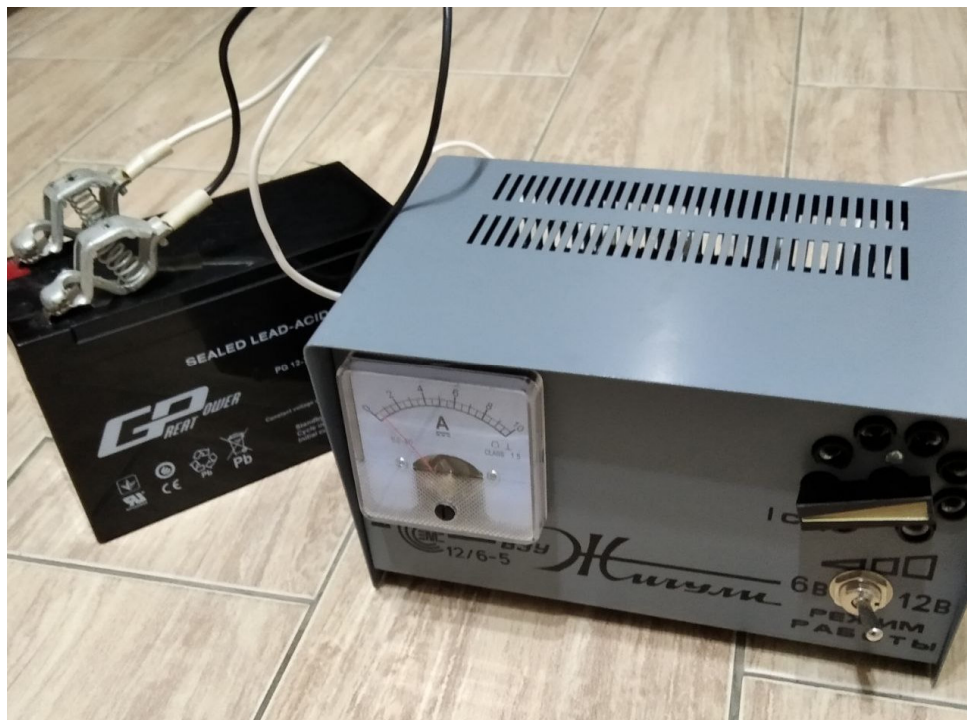
Рис. 1. Заряджання акумуляторної батареї GREAT POWER із використанням ВЗУ «Жигулі»

Для підтримки постійної величини зарядного струму під час заряджання акумуляторної батареї відбувалося його регулювання ручкою ступінчастого перемикачання зарядного струму, враховуючи, що положення I ст. відповідає найменшому значенню зарядного струму. Переключення ступінчастого перемикача зарядного струму у напрямку за годинниковою стрілкою призводить до збільшення зарядного струму.