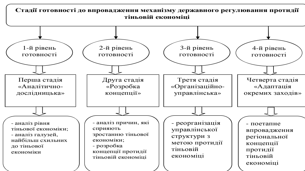
Рис. 1. Стадії готовності до розробки та впровадження концепції протидії тіньовій економіці [3; 6]

Проведені дослідження дають підставу зазначити, що процес впровадження концепції протидії тіньовій економіці на державному рівні протікає складно й нерівномірно. Вивчення стану протидії тіньовим відносинам дозволяє виділити чотири стадії готовності до впровадження концепції протидії проявам тіньовій економіці (Рис. 1).