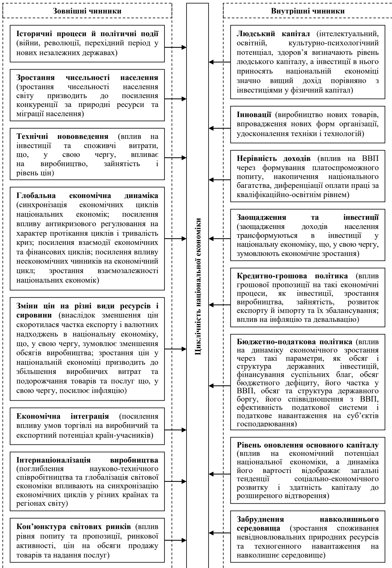
Рис. 1. Основні чинники циклічності розвитку національної економіки