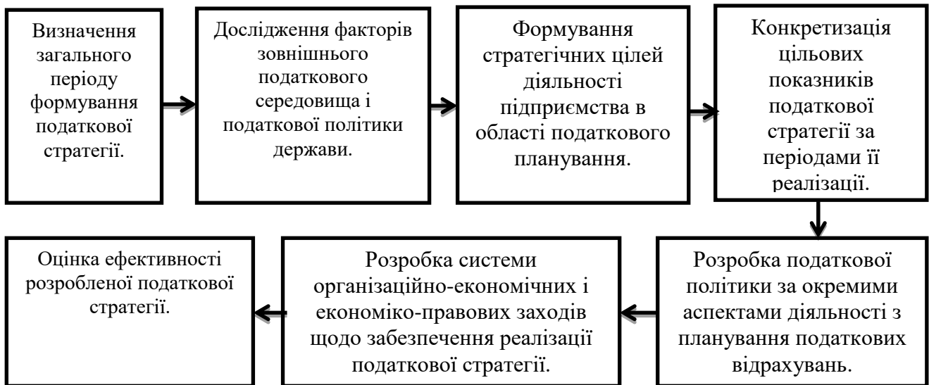
Рис. 1. Етапи процесу формування податкової стратегії підприємства

виступає товариство з обмеженою відповідальністю „ЕКОАГРО ФІРМА СЕМЕНІВСЬКА ЩЕДРА ЗЕМЛЯ” Семенівського району.