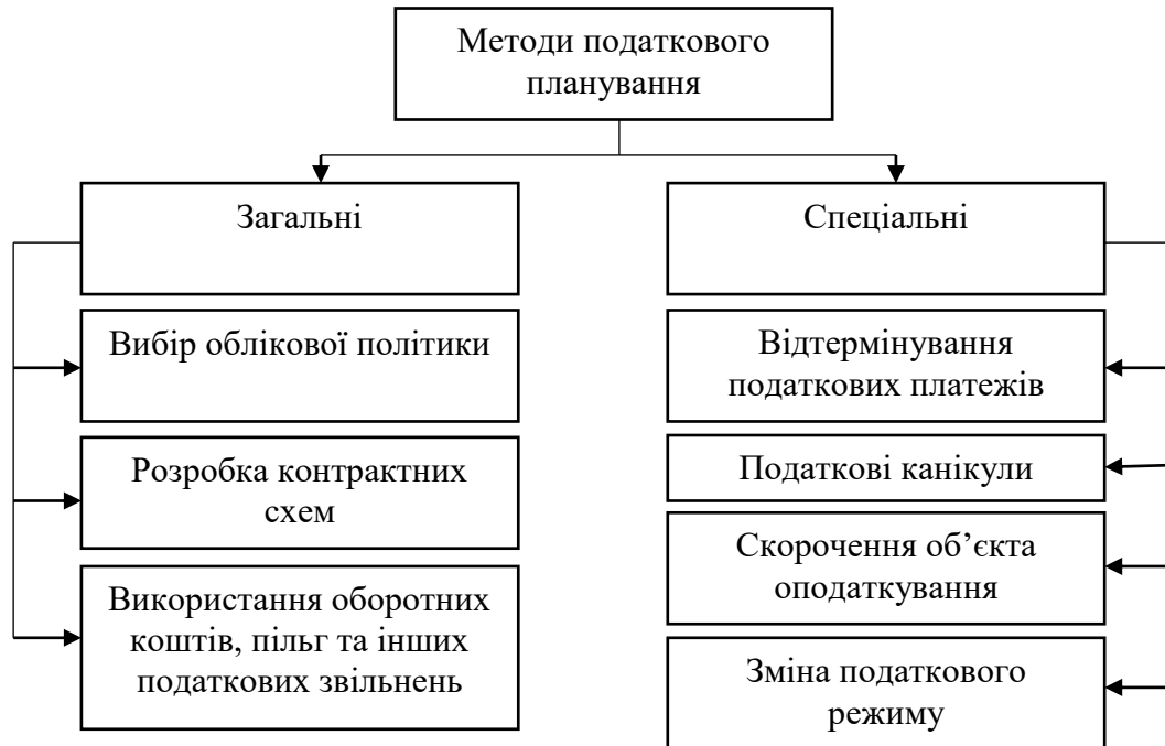
Рис. 4. Методи податкового планування на підприємстві

Для здійснення податкового планування на підприємствах малого бізнесу використовуються загальні та спеціальні методи планування (рис. 4).